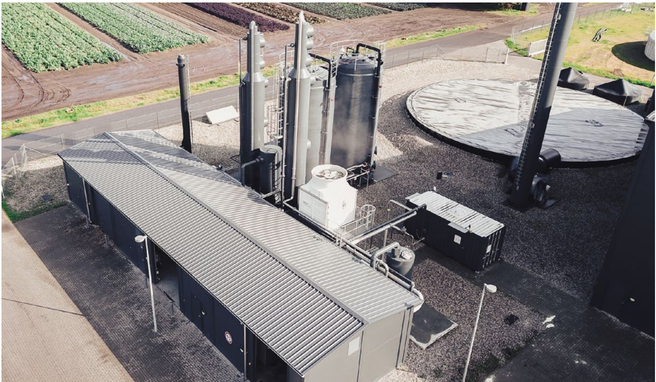
Projektet kommer med en lang liste med anbefalinger til, hvad bl.a. ejere af biogasanlæg kan gøre for at opnå en billigere og mere klimavenlig produktion af biogas.

muligheder for energiintegration ved øget varmeveksling, fx mellem den afgassede gylle og rågylle, eller øget varmeveksling mellem aminopgradering og rågylle. På elsiden kan installation af frekvensomformere på fx omrørere give besparelser.